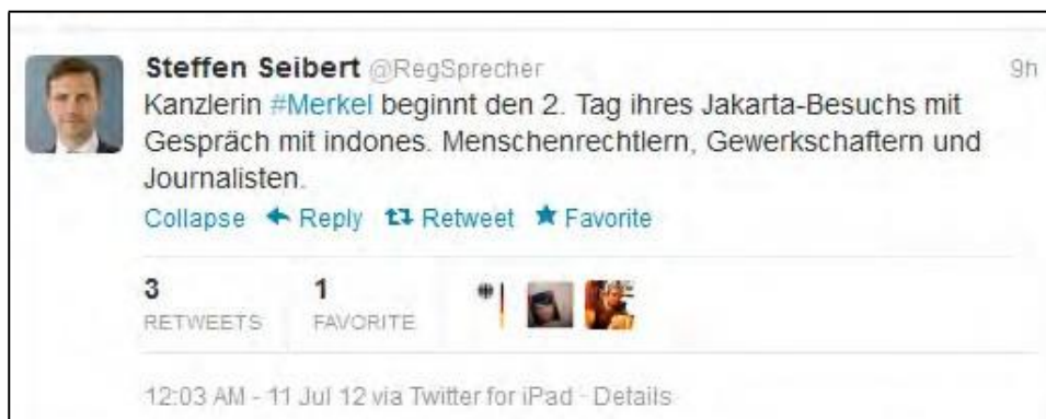
Abb. 1: Screenshot des Tweets von Steffen Seibert (@RegSprecher), vom 11.07.2012, Quelle: twitter.com