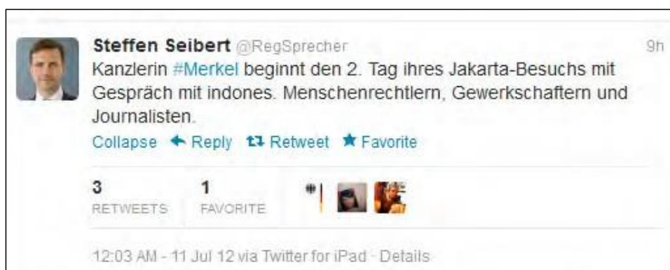
Abb. 1: Screenshot des Tweets von Steffen Seibert (@RegSprecher), vom 11.07.2012, Quelle: twitter.com