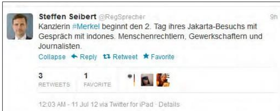
Abb. 1: Screenshot des Tweets von Steffen Seibert (@RegSprecher), vom 11.07.2012, Quelle: twitter.com