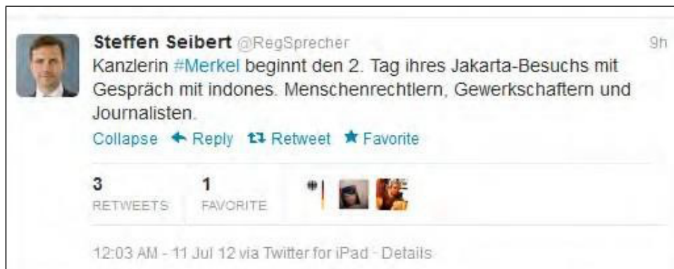
Abb. 1: Screenshot des Tweets von Steffen Seibert (@RegSprecher), vom 11.07.2012, Quelle: twitter.com